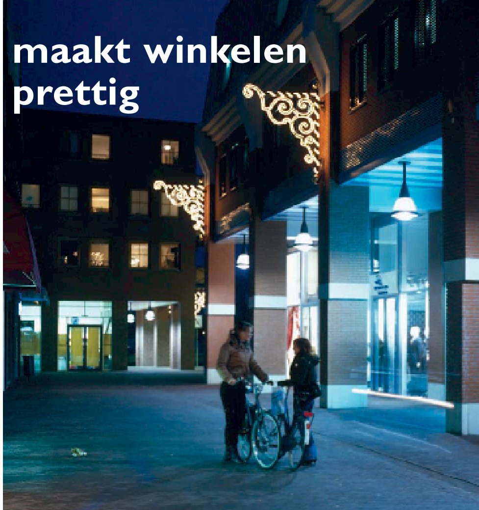
Foto's boven en rechtsonder: De Porto armatuur sluit zowel overdag als 's avonds naadloos aan op het karakter van de architectuur.